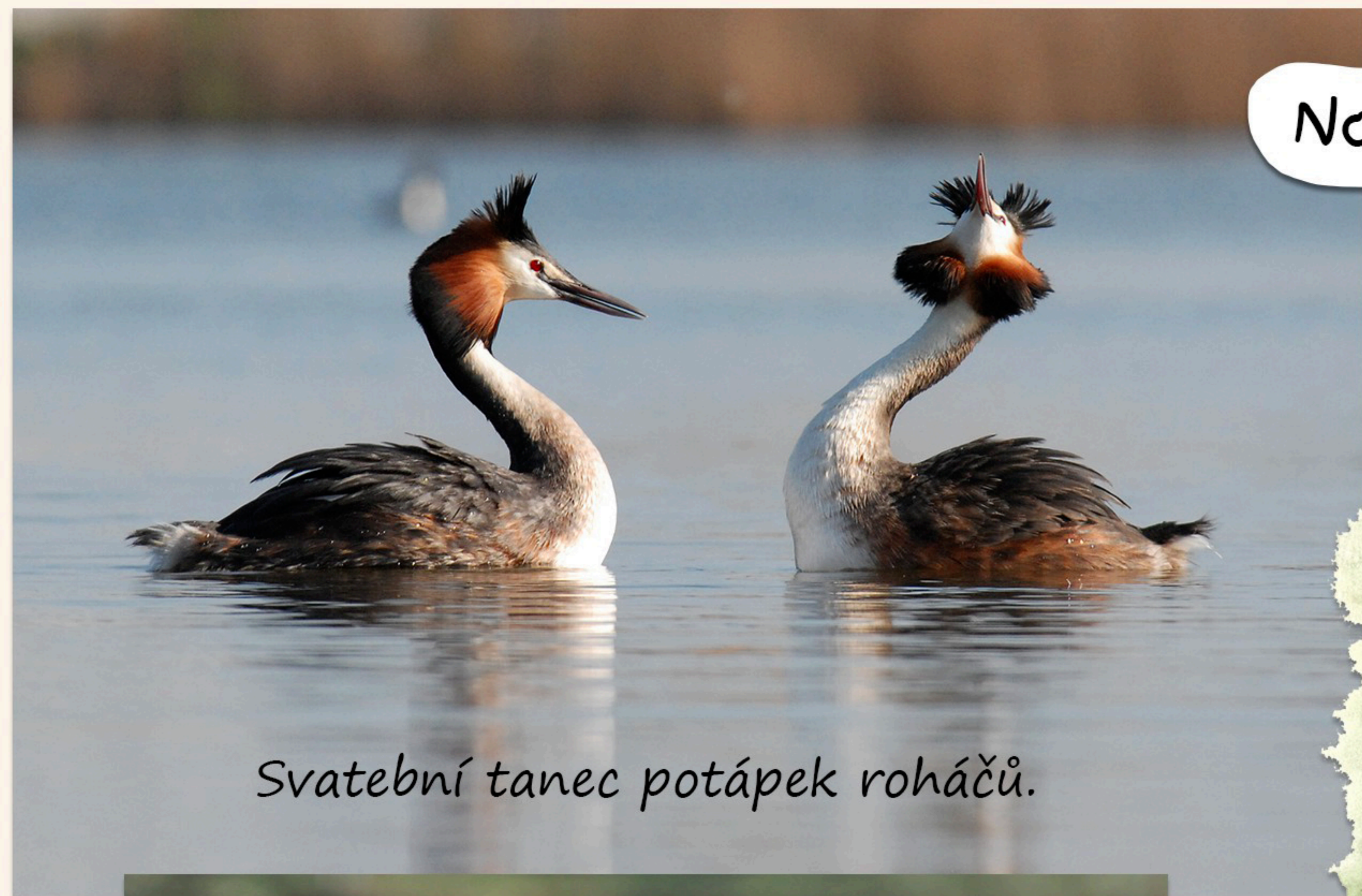
Svatební tanec potápek roháčů.

Ptáky žije na rybnících, řekách, bažinách a vůbec u vody spousta. Kdo je rád zkoumá a pozoruje, vybaví se nejlépe dalekohledem. Zapisník, nějaká ta tužka nebo pastelky a atlas ptáků se můžou také hodit.