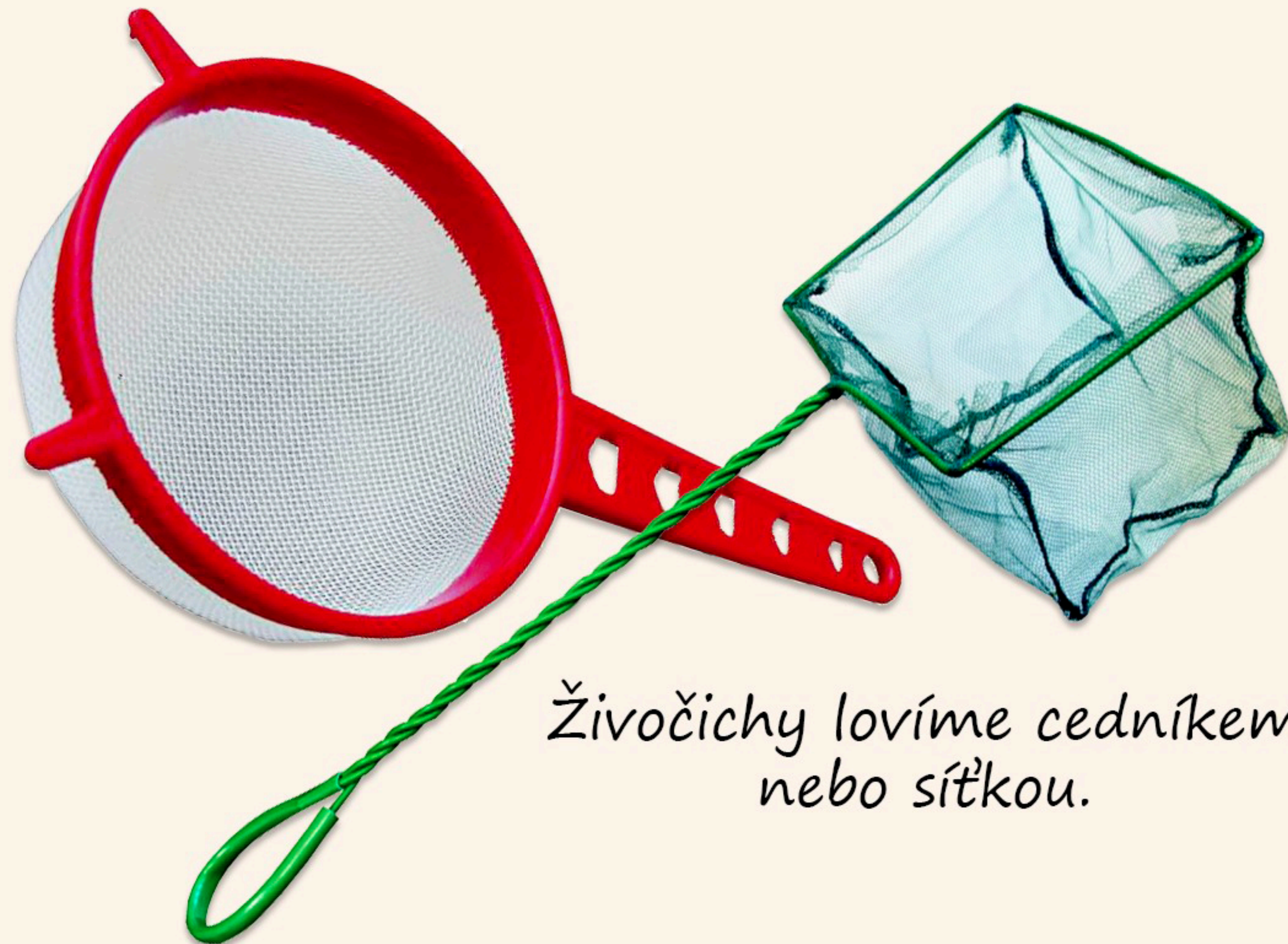
Živočichy lovíme cedníkem nebo sítkou.

Lov vodních živočichů, to je klasika. Ráchat se ve vodě baví snad každého. A ty objevy! Všelijaké potvory čtyřnohé, osminohé, slizké, kousavé, dokonce s klepety! Takže jen pár základních vychytávek a jdeme na to.