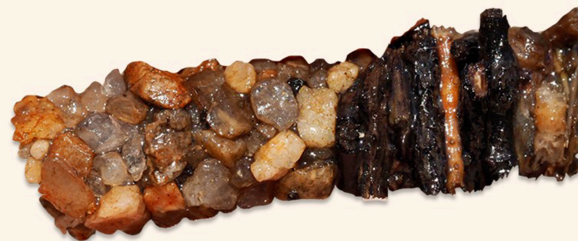
II. Larvy z proudu.

Závěr pozorování: Chrostíci žijící v klidné vodě si stavějí „domečky“ z lehkých materiálů, jako jsou kousky listů a stébla rostlin. Naopak chrostíci žijící v proudu budují těžké „domky“ ze zrněk písku a kamínků. Někteří z nich si je dokonce přichycují k větvím a kamenům na dně, aby je proud neodnesl.