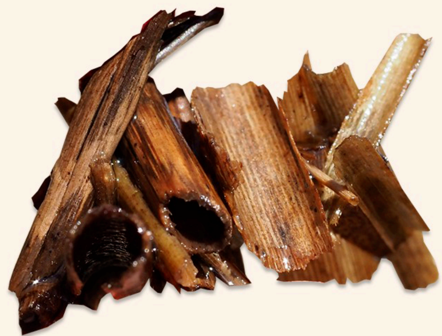
I. Larvy z klidné tůně u řeky.

Larvy chrostíků asi znáte. Žijí v tekoucích i stojatých vodách a většina z nich si staví „domečky“. Všimli jsme si, že používají různý materiál, nejen podle druhu chrostíka, ale i podle toho, žijí-li ve vodě stojaté, či tekoucí. A tak jsme si to zkusili porovnat.